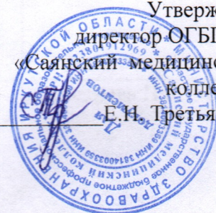
График учебных практик на 2023/2024 учебный год весенний семестр