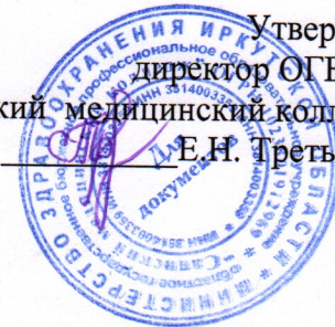
График производственных практик на 2023/2024 учебный год осенний семестр