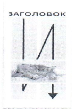
Рис.2 – Размещение заголовка и текста статьи

- В конце статьи заглавными буквами сведения об авторе: Ф.И.О. автора, должность, полное название учреждения.