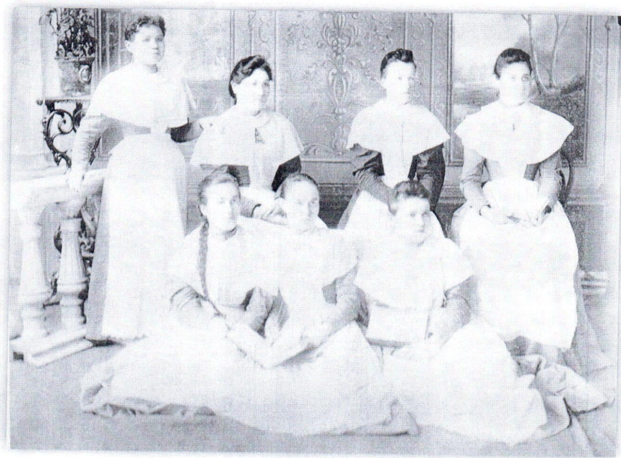
Рис.3 – Первый выпуск центральной для Восточной Сибири школы фельдшерниц, 1897 год